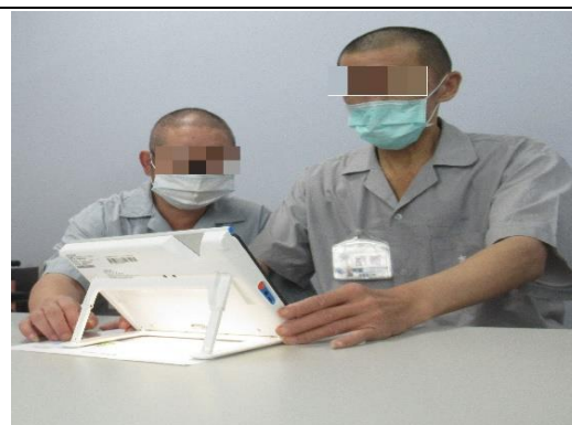
視覺輔具(擴視機)維持良好的視野，增進閱讀時的便利。