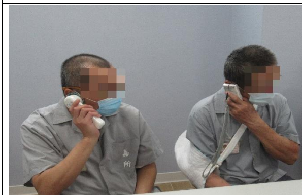
聽覺輔具(擴音輔具)讓溝通不再成為障礙，愛與聲音更靠近。