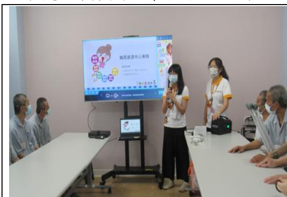
職能治療師解說輔具租借、輔具補助、輔具維修服務

監所為社會的縮影，日常生活有特殊需求之身障及高齡收容人，因其身體或心智上的限制，在所內會面臨許多生活適應之障礙，為使身障及高齡收容人能順利適應所內生活，本所於7月26日(週三)特別邀請「嘉義縣輔具中心」職能治療師入所辦理輔具體驗營，本次活動首先由職能治療師解說輔具中心所提供的輔具租借、輔具補助方案、輔具維修服務、及身心障礙福利資訊；再以日常生活實際使用情境，提供現場身心障礙收容人體驗各類視覺、聽覺及行動輔具，希望傳達在正確使用輔具下，讓收容人正確認識與及早輔具介入，提升生活動力。